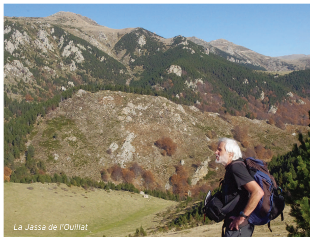
La Jassa de l'Ouillat